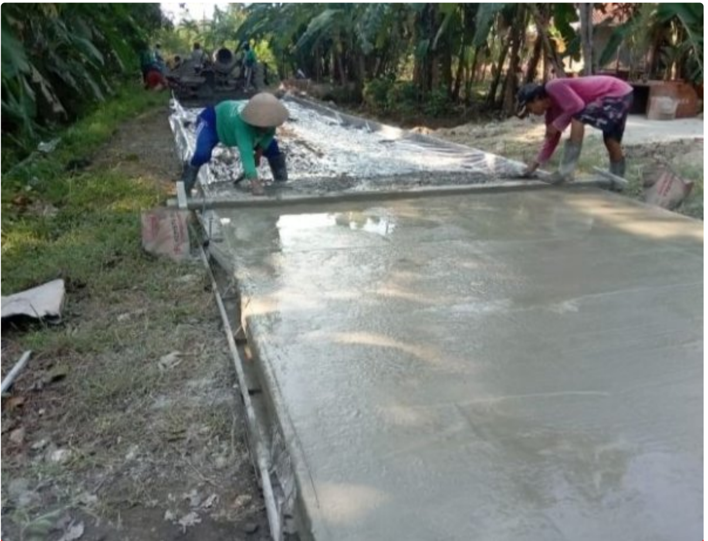
Pembangunan insfrastruktur Jalan Rabat Beton di Desa Rejamulya

REJAMULYA - Pemerintah Desa Rejamulya, Kecamatan Kedungreja, Kabupaten Cilacap melaksanakan Pembangunan Rabat Beton Jalan Lingkungan di Dusun Kedungdadap Jalan kenanga Desa setempat, Jum'at (28/06/2024).